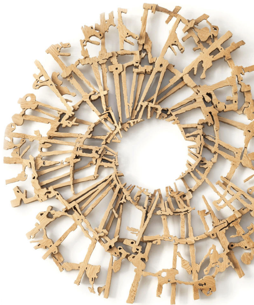
Govemotiv: 'Mutatis Mutandis' Wandobjekt aus Eichenholz, 144 x 144 x 9 cm - Alejandra Ruddolf

Galerie • Atelier III, Schlossinsel Rantzauer See, Tel.: 04123 - 3026 Di. bis Do. 14 bis 18 Uhr, Sa und So 12 bis 18 Uhr Rathaus Barmstedt, Kommunale Halle, am Markt 1, Tel.: 04123 - 681204 Aufgrund der Corona Pandemie ist das Rathaus bis auf Weiteres geschlossen. Bitte vereinbaren Sie zur Besichtigung der Ausstellung einen Termin. Stadtbücherei Barmstedt, Holstenring 10, Tel.: 04123 - 928802 Mo. bis Mi. 15 bis 18 Uhr, Do. 8 bis 12 Uhr und 15 bis 18 Uhr, Fr. 15 bis 19 Uhr