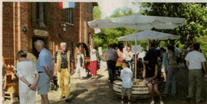
An der Wassermühle herrschte schon morgens Gedränge. Auch der Glücksbringer war wieder dabei.

■ (Barmstedt/rs) Historische Altstadt, See, Wald und Schloss-Insel - Barmstedt hat eine Menge für Einwohner und Touristen zu bieten. Und im Tourismusgeschäft sehen Geschäftsleute und Stadtbere durchaus Potenzial für die Schusterstadt. Die Einrichtung eines mit drei Mitarbeitern besetzten Tourismus-Büros war nur ein Schritt, um auf diesem Feld Marktanteile zu gewinnen. Ein anderer sind Veranstaltungen, die auf sanften Tourismus setzen - wie